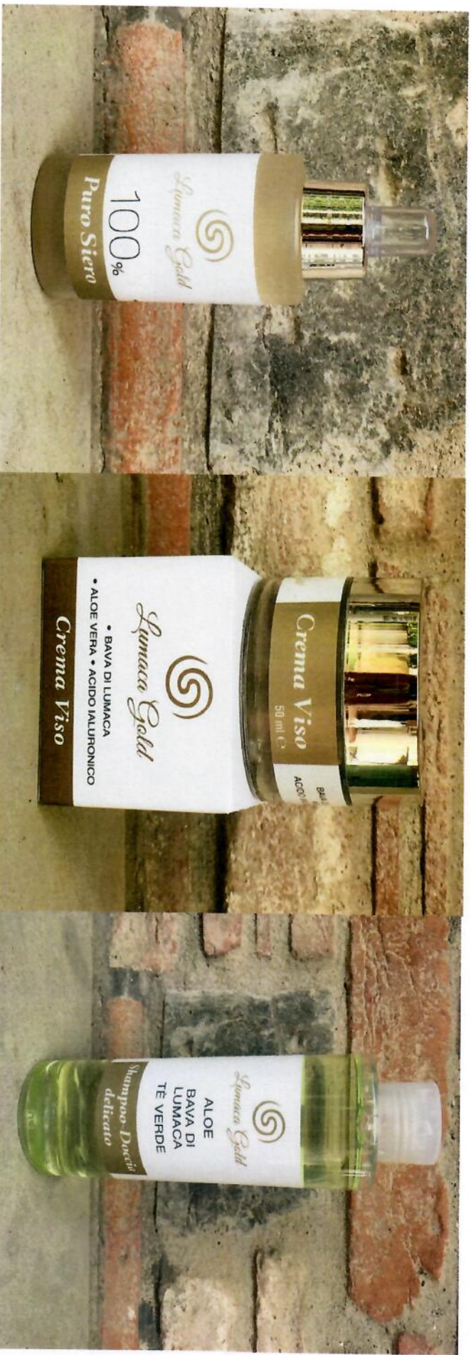
Puro Siero a 28 €